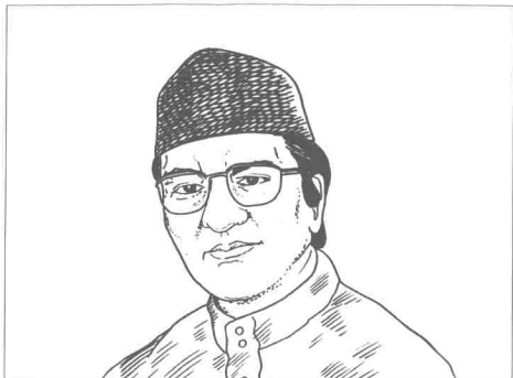
Dato' Seri Dr. Mahathir Mohamad

D ato' Seri Dr. Mahathir bin Mohamad merupakan Perdana Menteri Malaysia yang keempat. Beliau dilahirkan pada 20 Disember 1925 di Lorong Kilang Ais, Seberang Perak, Alor Setar, Kedah. Beliau diberi nama Mahathir kerana ibu bapanya mahu beliau menjadi seorang yang realisme.