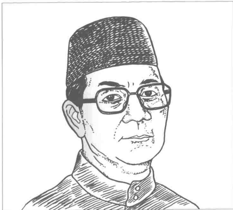
Tun Hussein Onn